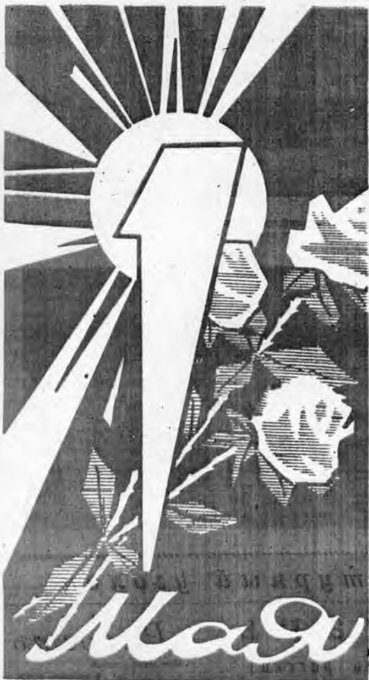
Плакат Ю. ИВАНОВА.

ОРГАН ПАРТКОМА, РЕКТОРАТА, КОМИТЕТА ВЛКСМ, ПРОФКОМА И МЕСТКОМА СТАВРОПОЛЬСКОГО СЕЛЬСКОХОЗЯЙСТВЕННОГО ИНСТИТУТА