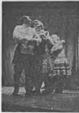
НА СЦЕНЕ — АНСАМБЛЬ НАРОДНОГО ТАНЦА.

Как лучшему среди вузов города коллективу художественной самодеятельности нашего института была предоставлена возможность 11 мая выступить с отчетным концертом перед трудящимися города в Зеленом театре парка культуры и отдыха имени Ленинского комсомола. Тепло и радушно принимался каждый номер кон-