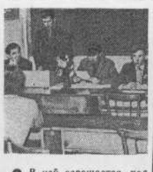
● В ней освещается ход Ленинского зачета, участие молодежи во всех общественных мероприятиях института.