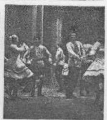
● Факультет общественных профессий широко представлен на страницах нашей многогазетки.