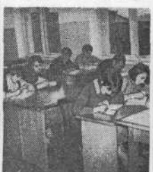
● Газета на своих страницах рассказывает об учебном процессе, конкурсе на лучшую учебную группу.

Подписка на нашу газету принимается в редакции от комсоргов групп и профгрупп кафедр. Стоимость подписки на год — 50 копеек.