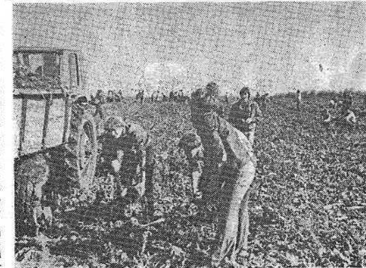
Студенты 3-го курса факультета механизации на уборке свеклы.

Несмотря на то, что почва все же была еще сырая и много времени и сил уходило на очистку свеклы от земли, никто не отсту-