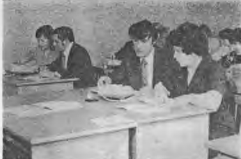
На снимке: лучшая на экономическом факультете — I группа II курса.

Приятно говорить о хороших студентах и о хороших делах, од-