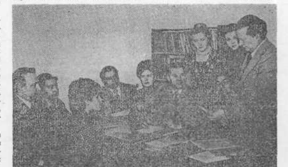
На снимке: идет заседание кафедры микробиологии и вирусологии. Этот коллектив является победителем соревнования за образцовую кафедру института.

Успешно выполняются социалистические обязательства факультетами зооинженерным и электрификации.