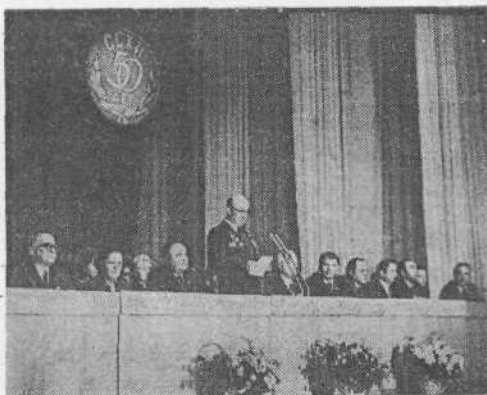
Президиум торжественного собрания.

РЕПОРТАЖ о торжествах по случаю 50-летнего юбилея нашего института хоте-