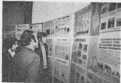
НА СНИМКЕ: гости знакомятся с выставками.

После этого был дан большой праздничный концерт в двух отделениях, в котором участвовали студенты, слушатели и преподаватели различных отделений ФОП института, преподаватели музыкального и культурно-просветительского отделений, участники солдатской художественной самодеятельности.