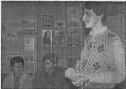
Одной из комсомольских групп агрономического факультета — I-й IV курса — было предоставлено почетное право провести Ленинский зачет в музее боевой и трудовой славы института.