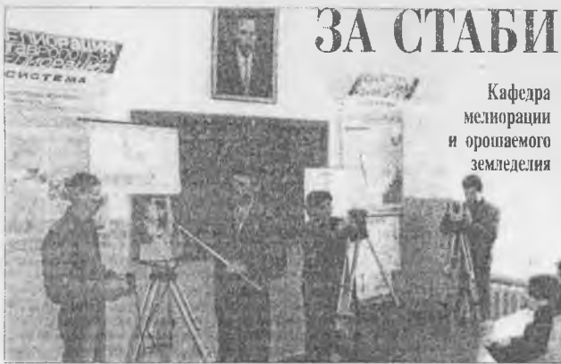
Кафедра мелиорации и орошаемого земледелия