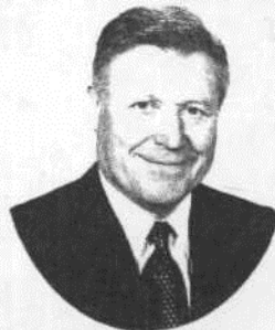
Академик РАН Виктор РЯДЧИКОВ:

«Эти знания базируются на понимании процессов жизнедеятельности организма, биосинтеза продукции, их неразрывной взаимосвязи с физиолого-биохимическими процессами усвоения и обмена питательных веществ».